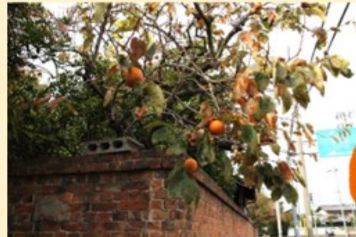
萬徳寺東側歩道上で実る柿