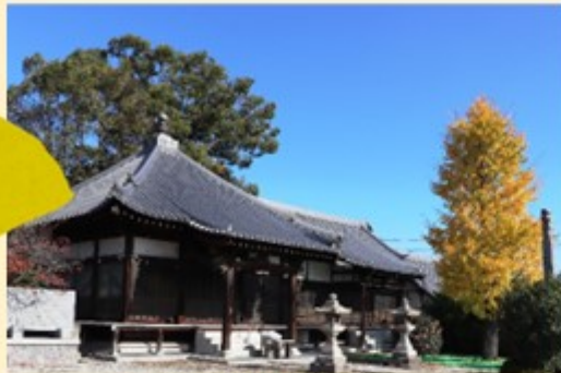
萬徳寺のイチョウ

香西町内にはこれといった紅葉スポットも無く秋の自然を感じる機会が少ないですよね。これらの画像はホームページ委員会が今までに町内を回って撮った秋を感じられるスポットです