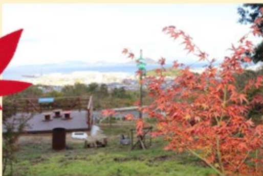
香西里山いこいの場のモミジ