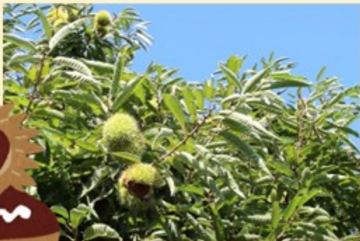
今池近くの栗の木