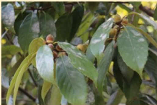
香西寺のコナラやクヌギのどんぐり