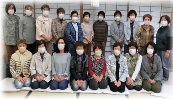
令和4年度 運営委員

市婦連から退会し、香西コミュニティの一員として、より一層地域に根ざした活動をしていきます。行事への参加や、若い方への声掛けなどよろしくお願ひします。