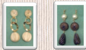
9月の作品 見本です!