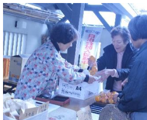
「甘〜いみかんが大人気」