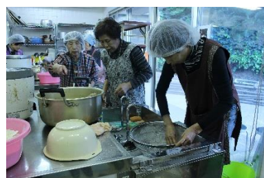
♡心をこめて作りました♡